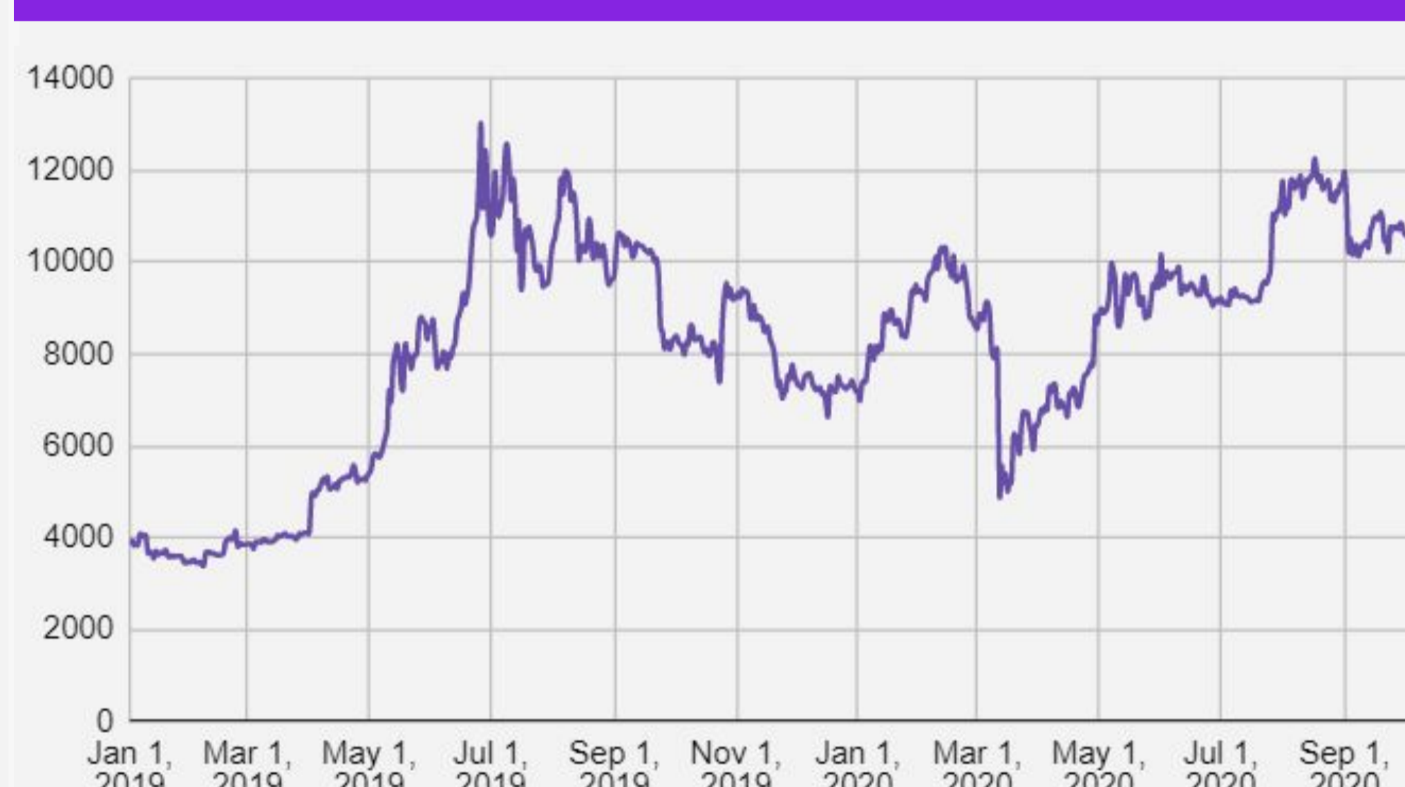
Cours du Bitcoin vs USD