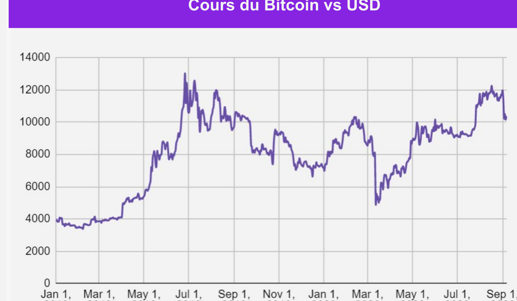
Cours du Bitcoin vs USD